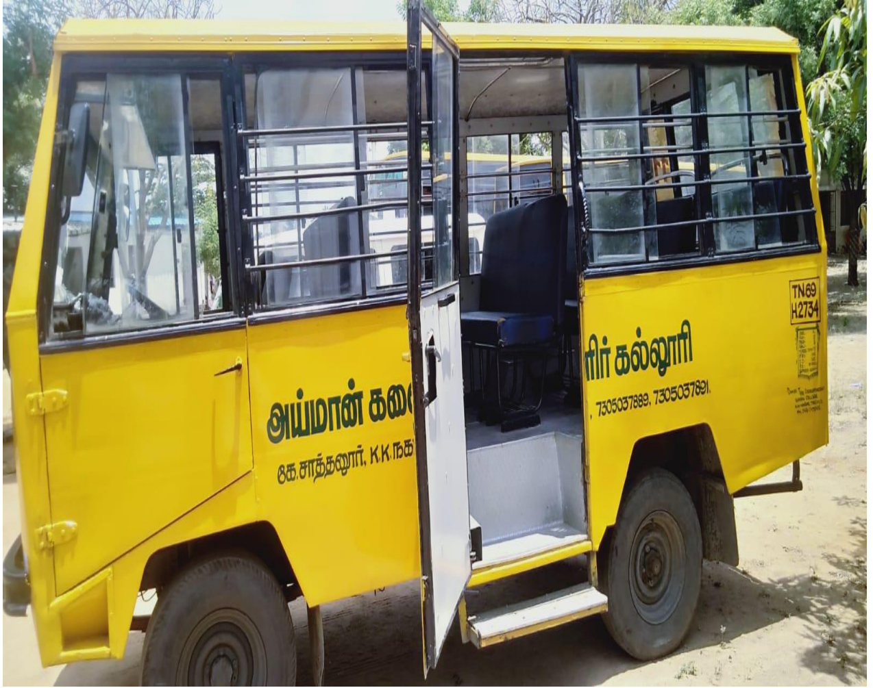
LOW FLOORING STEPS IN COLLEGE BUS