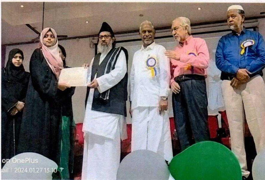
The course certificate was given by the institution's president.