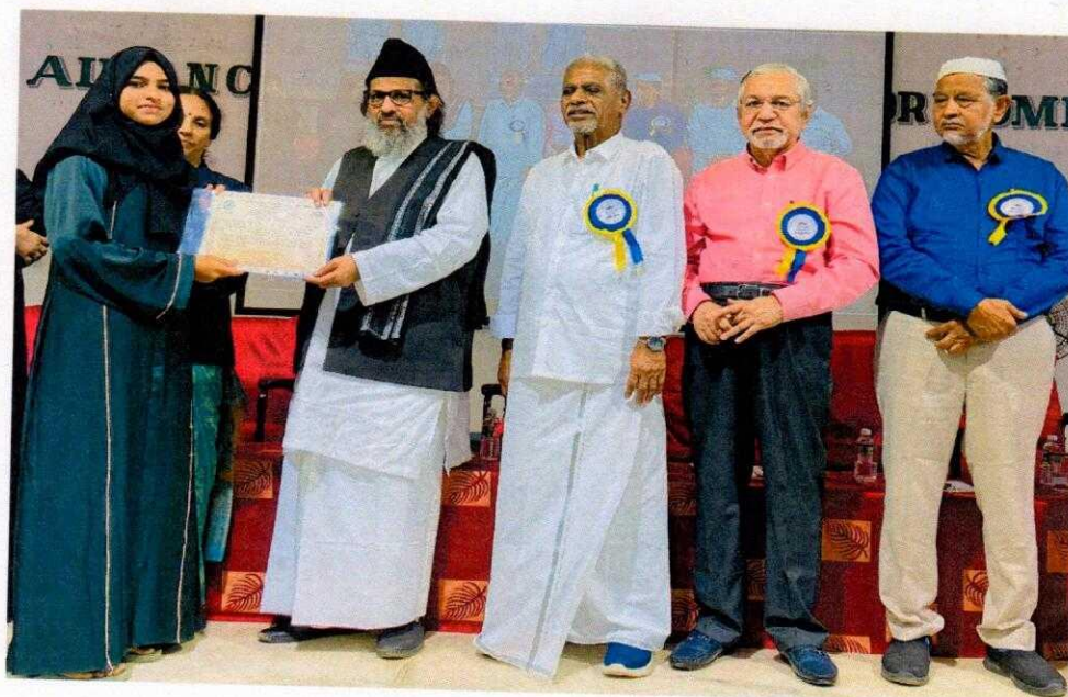
The course certificate was given by the institution's president.