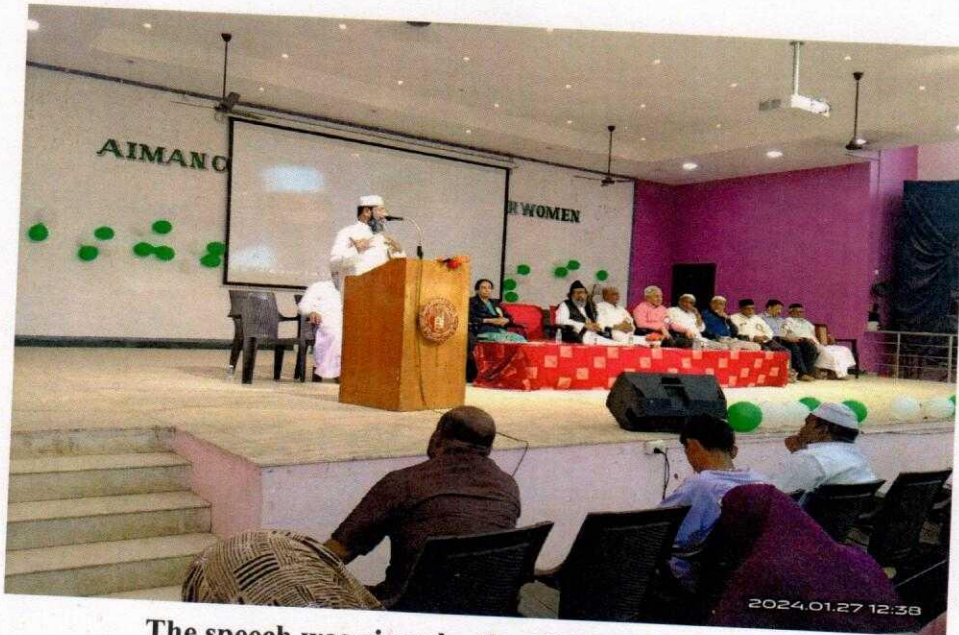
The speech was given by the Chief Guest.