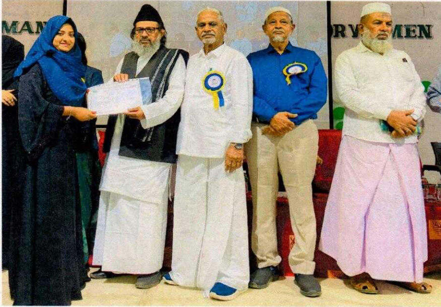
The course certificate was given by the institution's president.