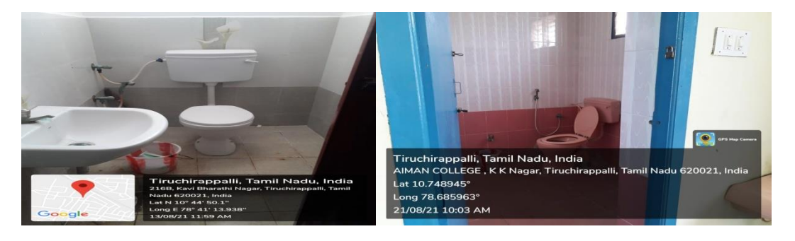
Hostel New Block Ground Floor